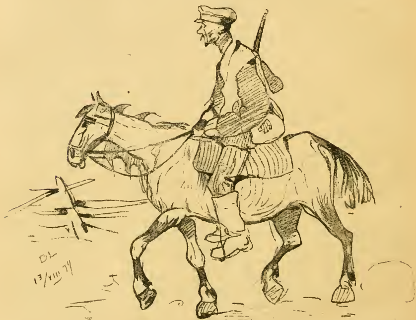
Конный развѣдчик — Мих. полкѣ.

Характерно то, что союзническія военныя части и высокіе комиссары вѣдь видѣли и знали все это, имъ была открыта истинная картина и до мелочей было знакомо положеніе дѣла: и предательство на фронтѣ, и безконечный грабежъ союзника-Россіи, и вмѣшательство въ государственныя дѣла, и угрозы самой возможности дальнѣйшей борьбы отъ присутствія въ тылу этой многотысячной разнузданной, вооруженной массы.