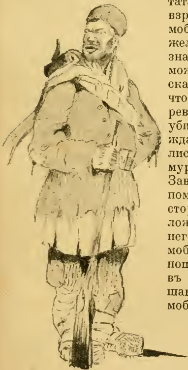
Израевской волости — помощникъ

— «Не надо, бачка, не надо, моя не надо,» кричалъ онъ,