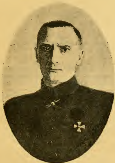
Верховный Правитель и Верховный Главнокомандующій, Адмиралъ Александръ Васильевичъ Колчакъ.

18 Ноября 1918 года адмиралъ Колчакъ былъ поставленъ передъ совершившимся фактомъ. Онъ подчинился ему и принялъ на себя всю полноту Верховной власти.